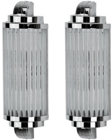
Halbrunde Wandlampe Neuanfertigung Art Déco Nr. 109