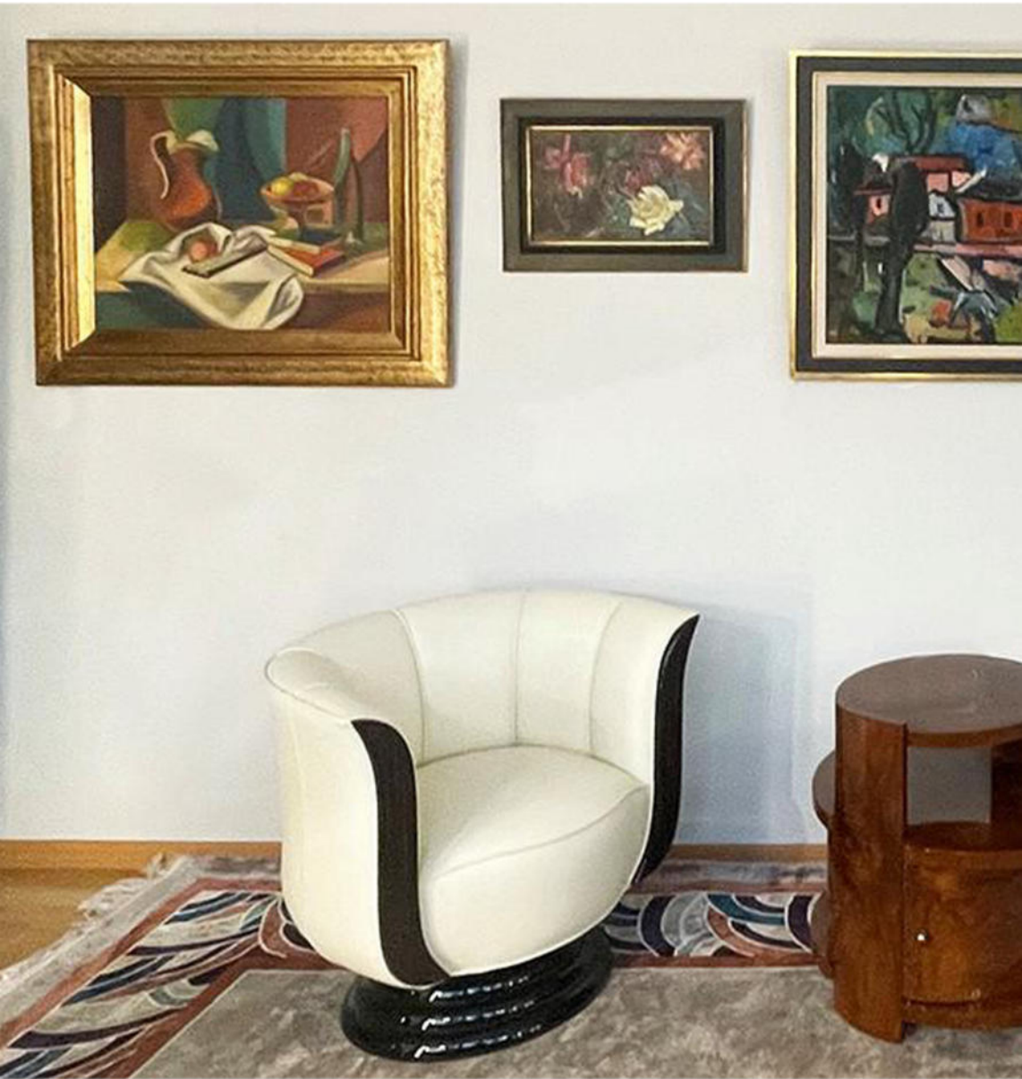
Elegantes Paar Luxus Sessel im Art Déco Stil Neuanfertigungen. Nr. 2693