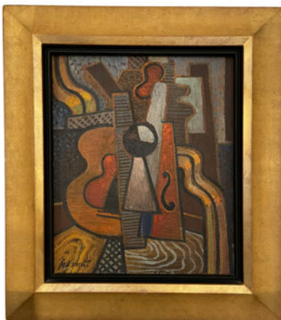
Kubistisches Stillleben mit Violine, signiert „Gilberte Schmitt“. Nr. 2786