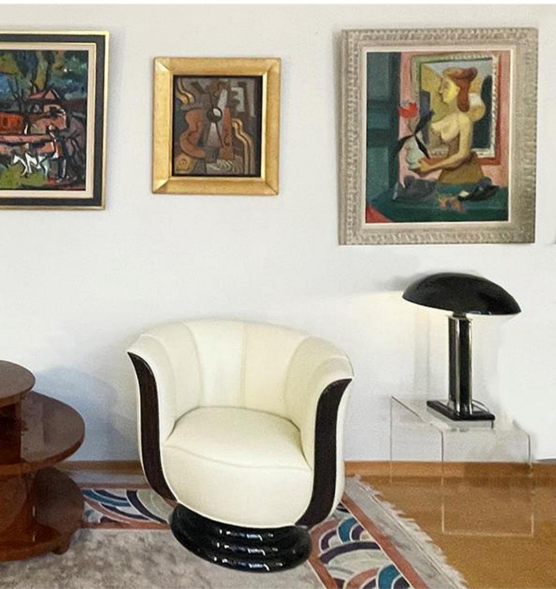
Art Déco Tischlampe Jacques Adnet zugeschrieben, Frankreich um 1925. Nr. 2732.