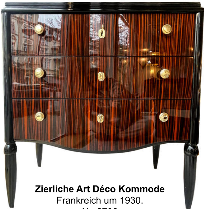
Zierliche Art Déco Kommode Frankreich um 1930. Nr. 2702