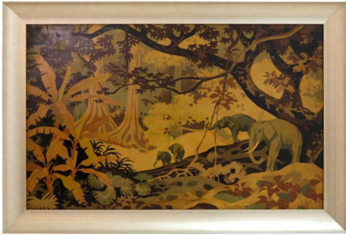
Art Déco Gemälde „Dschungel“ Frankreich um 1930. Mischtechnik. Nr. 2349