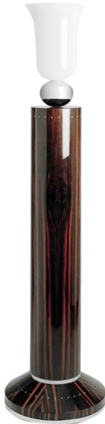
Große Art Déco Stehlampe Neuanfertigung, Edelholz. Nr. 1200