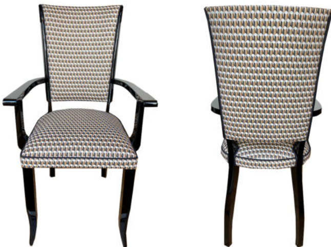
Art Déco Stuhl mit Armlehnen Schwarzlackiertes Holz, Frankreich um 1930. Nr. 2408