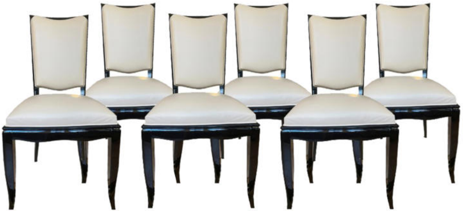
Eleganter Satz von 6 gleichen Art Déco Stühlen Frankreich um 1925, schwarz gelackte Hochlehner. Nr. 2791