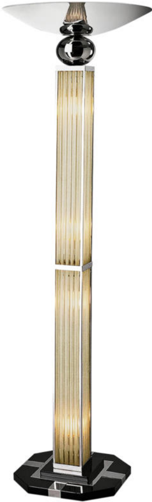
Rechteckige Stehlampe mit großer Schale, Neuanfertigung. Nr. 1240