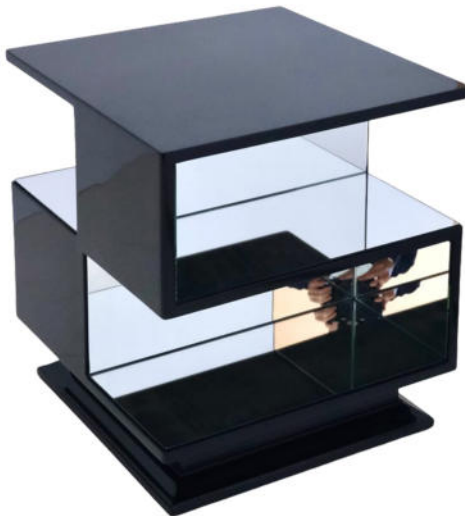
Kubistischer Tisch Art Déco Frankreich um 1930. Nr. 2350