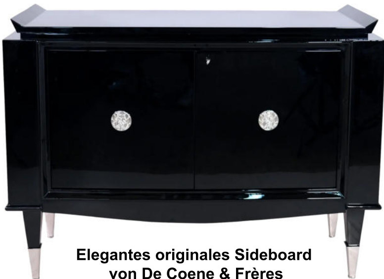
Elegantes originales Sideboard von De Coene & Frères Art Déco, Belgien um 1940. Nr. 2639