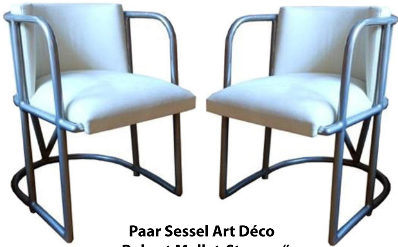
Paar Sessel Art Déco „Robert Mallet-Stevens“ Frankreich um 1932. Nr. 1504