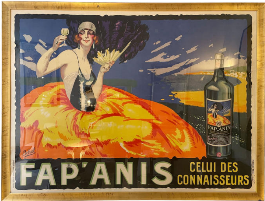
Großformatige Art Déco Lithographie „FAP'ANIS“ um 1925. Nr. 2783