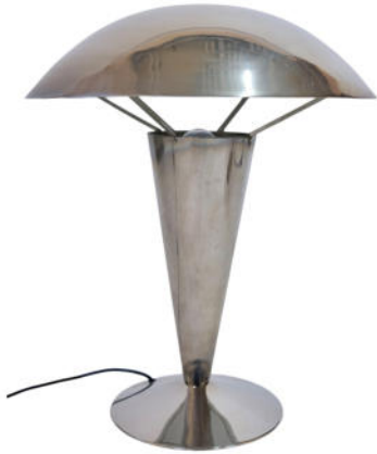
Art Déco Schreibtisch Lampe Frankreich um 1925. Metall verchromt. Nr. 2448